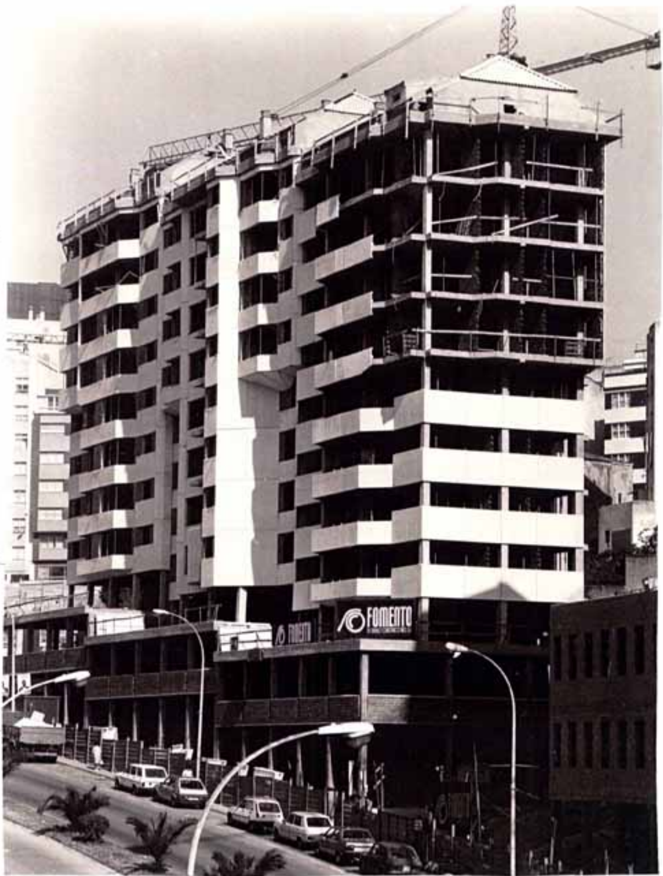
PROYECTO DE 56 VIVIENDAS EN A CORUÑA. 1985