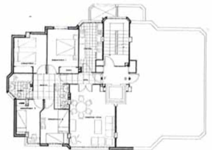
VIVIENDA TIPO F.